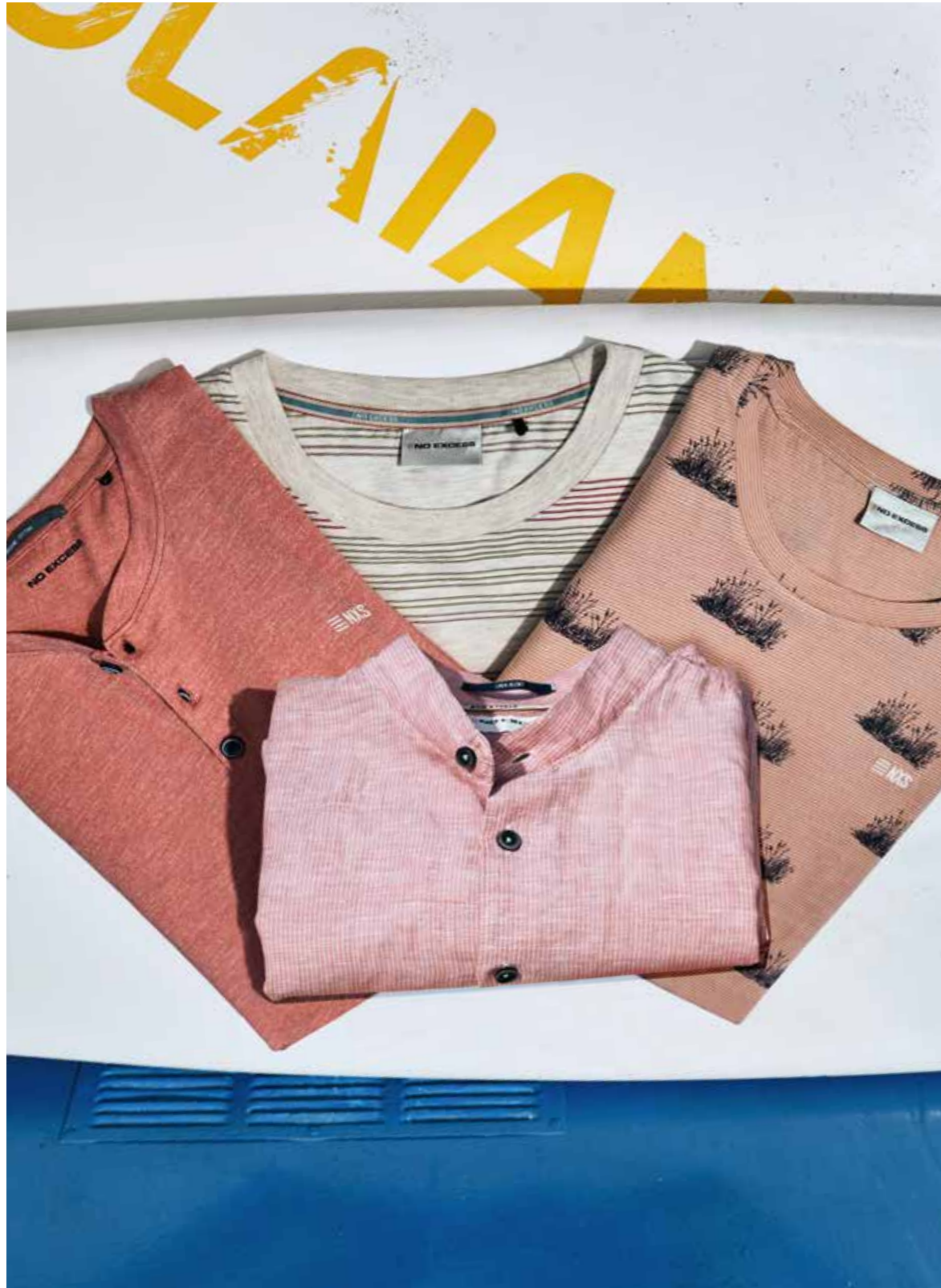
Stehkragen-Hemd NO EXCESS 59.99€ T-Shirts NO EXCESS gemustert, je 39.99€ T-Shirt NO EXCESS Uni mit Knöpfen 34.99€