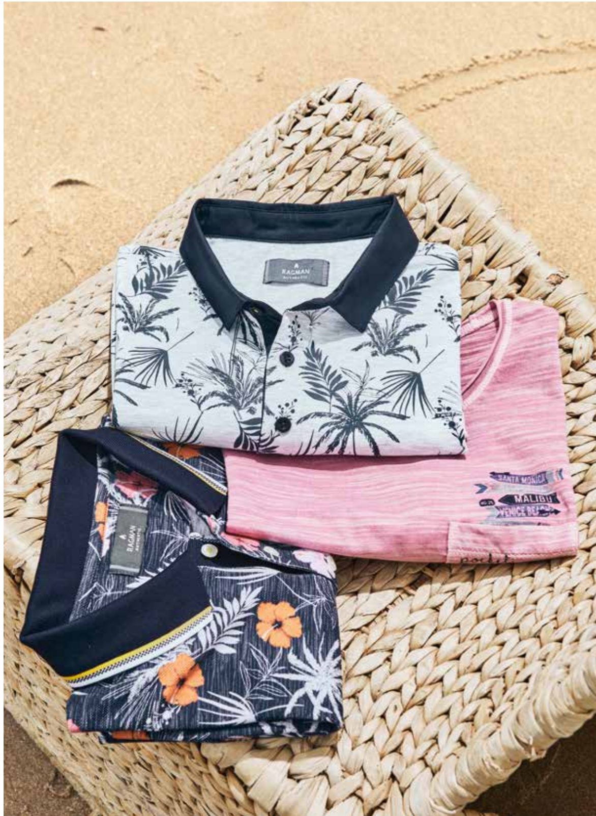
Baumwoll-Polos RAGMAN, je 59.95€ T-Shirt RAGMAN 39.95€