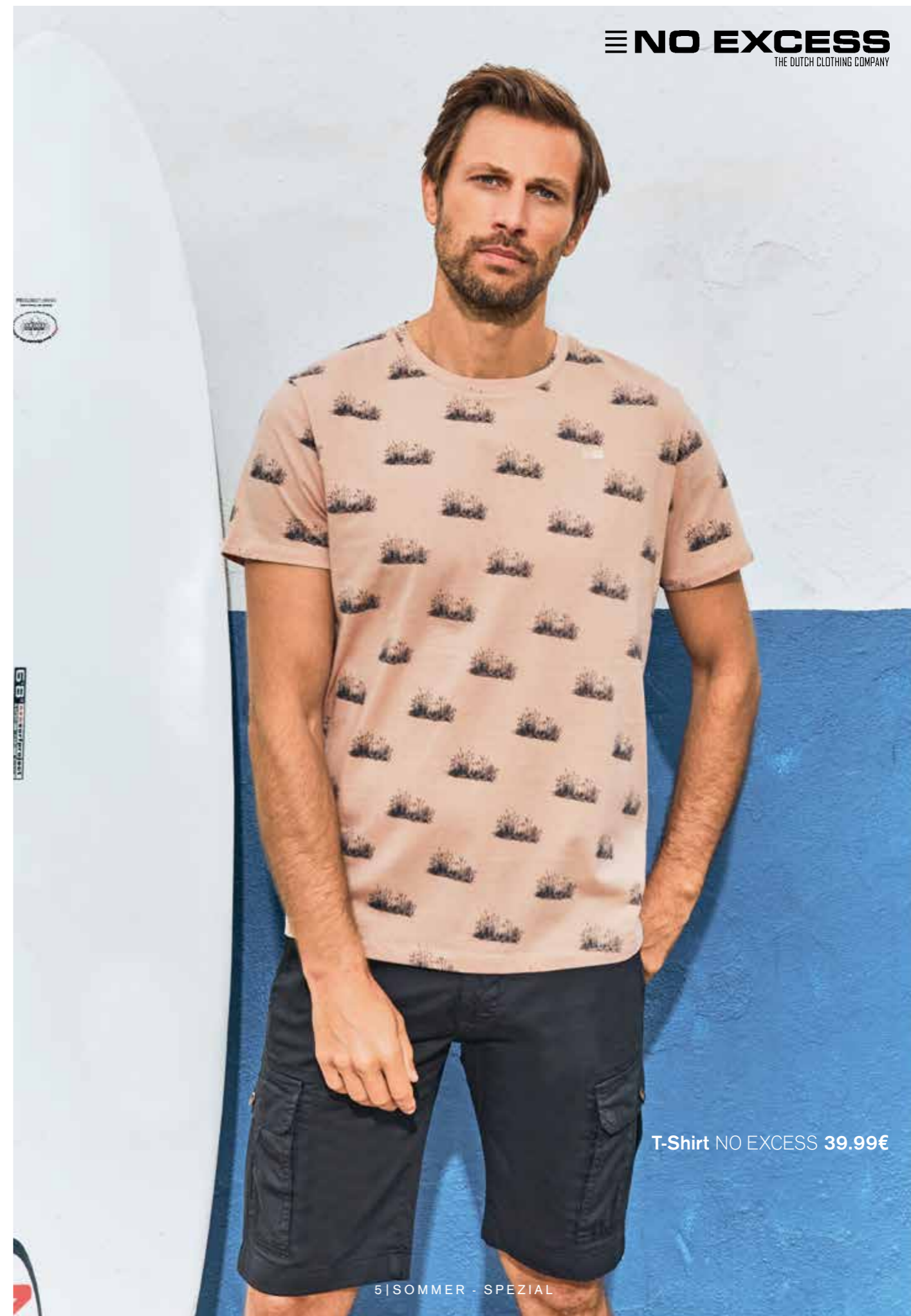
T-Shirt NO EXCESS 39.99€